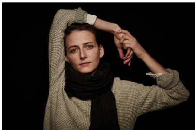
Jasmine Ellis © Jasmine Ellis Projects