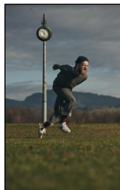
"Is Susan lonely?" by Jasmine Ellis Projects: Lukas Bamesreite