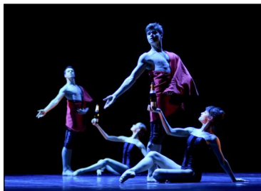
"Petite Corde" von Ji í Kylián