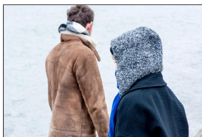
„RIVERS – Choreographers in Residence“ - das neue Format der Tanzstelle R

Aktuelle Informationen unter: www.tanzstelle-r.de