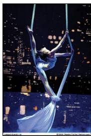
„Cirque Eloize“ mit „ID“

Durch die unendlichen Energie der Crew und ihrer Musikalität hielt auch ein Bike-Stunt-Künstler die Zuschauer in Atem, genauso wie die ideenreiche und inspirierende Stuhlakrobatik, die in himmlische Sphären reichte oder die nicht enden wollenden Sprünge an der überdimensionierten Trampolinwand, die das aufregende Finale bildeten. Es ist eine Show der Superlative, inspiriert durch Bernsteins „West Side-Story“, eine moderne Zirkusshow, die weit mehr ist als eine Abfolge von Artistiknummern.