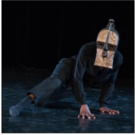
„Kifwebe.01“ von Miguel Mavatiko © Jo Grabowski; Lars F. Menzel