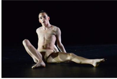
„Mutiko als Neska“ von Benoit Cuchot