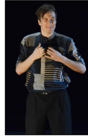
„We Do This. We Don't Talk“ von Barnaby Booth; Samuli Emery