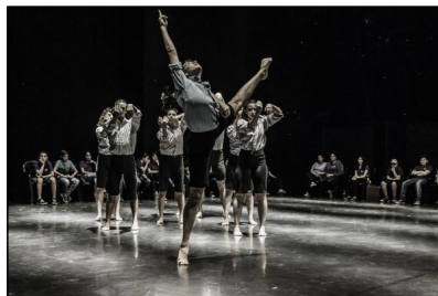
Kibbutz Contemporary Dance Company 2 „360°“ @ THINK BIG! #6